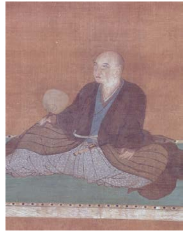
細川幽斎公画像(天授庵所蔵)