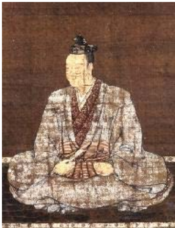
明智光秀公画像（本徳寺所蔵）