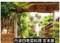
丹波四季菜料理 宮本屋