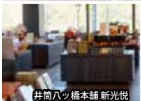
井筒八ッ橋本舗 新光悦