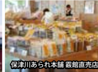
保津川あられ本舗 霞館直売店