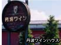
丹波ワインハウス