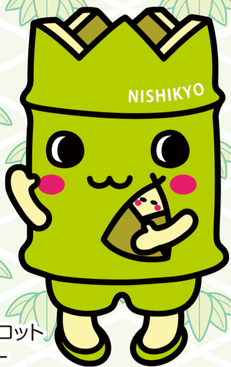
西京区マスコットキャラクター「にしきょう・たけによん」