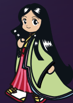
向日市観光協会 マスコットキャラクター かぐ歩ちゃん