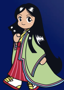
向日市観光協会 マスコットキャラクター かぐ歩ちゃん